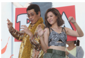
人気タレント・安心亜 ( 右 ) のサイン会に、台湾でも話題のピコ太郎が乱入 = 13 日、台北