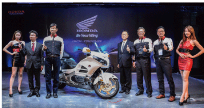
台北市で開かれた「ゴールドウイング」の発表会＝11日