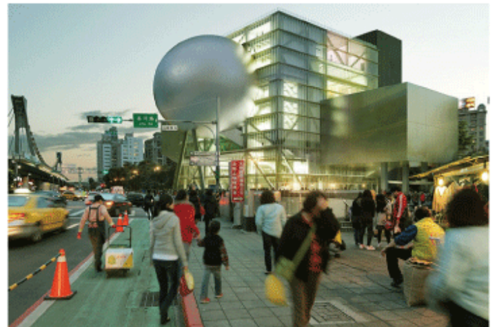
台北芸術表演中心の完成予想パース

理成營造は1980年創業。これまで百貨店大手、新光三越百貨の店舗や高級ホテル「寒舍艾麗酒店(ハンブルハウス台北)」などを手掛けた。衣董事長によると、今後はできる限り早く董事会(取締役会)と株主総会を開き、破産申し立ての手続きを進める予定。