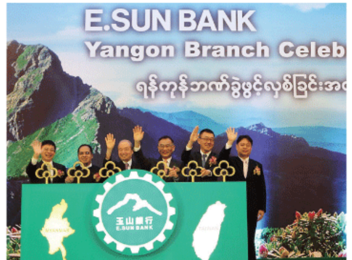
玉山銀行ヤンゴン支店開業セレモニーに出席した関係者=9日、ミャンマー

玉山銀は 1992 年の設立。13 年 7 月にヤンゴン駐在員事務所を開設していた。